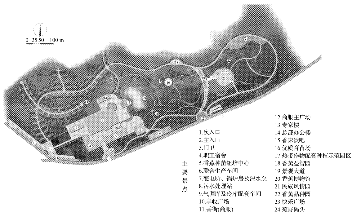
图 2 孟定香蕉主题休闲园景点分布图