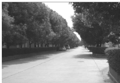
图 4 福保村道路

新农村的道路一般都有 1 条或几条主干道,以及村庄内街道。在绿化过程中,主干道可以采取乔、灌、草相结合的方式,乔木选择当地的乡土树种,灌木以观赏性较强的树种为宜 [7] 。福保村的主干道为三版两带式,属城市化道路。绿化基本以高大乔木滇润楠为主,几乎没有配置草本,灌木的配置观赏性不强,略显单一(见图 4)。