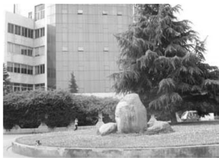
图 3 福保村入村口

公共活动区是村民休闲时聚集的场所,最能体现村庄的个性和特色。这类区域的绿化应体现出活泼、有趣的园林设计特点,并提供各个年龄段村民的活动设施和