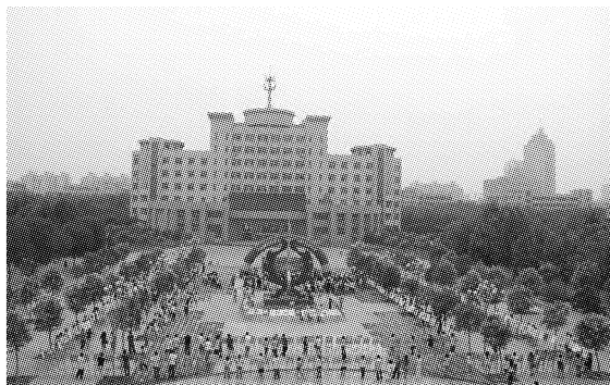
图2 广场应用现状-作品展览

2人占72%,知己、关系好的同学或男女朋友,主要是聊天或一起讨论学习等;3人及以上占8%,主要进行社会性活动(读书节开闭幕式等)、专业作品展览、班级活动聚集场所及无计划群聊(图2)。通过对不同人群的行为方式调查得出,图书馆广场景观设计需要增加休憩设施。同时广场周围的环境决定了休憩设施增加的必要性,广场西侧的学生第一餐厅、水果超市、快递公司、邮局和东侧的弘德湖滨水景观区增加了广场空间的活力。学生第一餐厅、水果超市、快递公司、邮局的存在引发了学生的必要性活动,为广场增加了潜在的使用者;弘德湖滨水景观区的存在增加了学生在此停留的时间。因此,图书馆广场景观空间的构建要真正做到“以人为本”,必须从学生的学习、生活及一系列校园活动为出发点,创造舒适、快捷、高效的学习场所。提供不同形式和层次的交往场所,对图书馆广场空间的每一个场所都要进行精心设计,形成具有潍坊学院特色的校园环境。