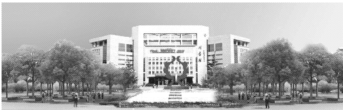
图4 广场景观提升设计效果

体现人性化的设计原则,广场景观空间整体采用无障碍设计,地面铺装采用防滑设计、台阶处处理局部为缓坡等。