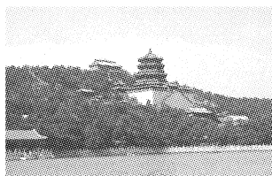
图1 颐和园的山水语言