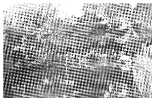
图2 狮子林的山水语言