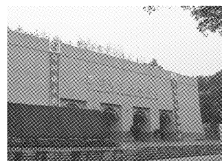
图3 西安建筑科技大学西大门

2.2.2 以地方文化为基础的地域性承载 加强高校地域文化景观建设不仅可以形成极富特色的校园环境,而且可以加深师生对校园所在地的文化认同感和归属感。尊重高校所在城市已形成的文化肌理,传承其城市文化,与整个大文化环境融为一体,融会贯通,才能造就独一无二的文化景观。身处十三朝古都的西安建筑科技大学,为庆祝建校110周年并校50周年新修建的西大门,其建设延承唐风,以城墙为形,以精美石刻为饰,庄重宏伟。真正从地域特色出发,提升了整个大学的文化底蕴(图3)。