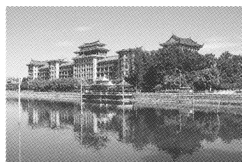
图2 厦门大学道南楼

在社会和文化背景下,当把地域性自然因素限制作用的理解提升至超越浅显的物质层面时,其对景观的作用就由形象化上升为象征化。若把地域系统中的自然和文化因素有机地结合起来,就可促进新文化景观形式的出现和发展。高校的建设过程实际就是大学校园文化的形成过程。著名爱国华侨陈嘉庚先生于1921年创办的厦门大学,其景观规划结合了闽南地区自然气候条件,因地制宜,最大限度发挥地形优势。其中注重闽南式大屋顶与西式外廊式样的巧妙结合,以斜屋面、红瓦、拱门、圆柱、连廊、大台阶为基本特征的“嘉庚建筑”是继承自然因素,塑造地域性文化景观的典范(图2)。