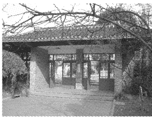
图5 同济大学原第二学生食堂大门

由于各种原因难以容纳后续事件发生所需要的空间,这时需要考虑对原有空间的适宜性改建和功能匹配,同时要注意其与周围空间的兼容性和具体空间转换问题 [10] 。同济大学原第二学生食堂大部分建筑墙面被拆掉,只留下食堂的前后大门并加以修砌,现起到限定空间的作用,这样做既保留了人们的记忆又满足学校的实际需求(图5)。通过后景观改造,原建筑空间现已成为同学们接收快递的公共空间。另外,对景观的再利用时考虑将过去时转化为现在时的同时,所改造的景观空间也要注重对过去时拥有的价值进行延续和传递。