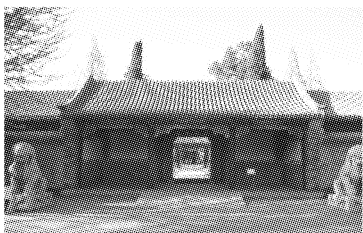
图1 清华园的主体建筑—工字厅

校的成长历史,是一所高校的新校区能在几个月建设出延续早年建筑风格的建筑,但无法通过植被展示高校浑厚的历史底蕴。高校校园中道路两旁的高大梧桐树常是很多毕业生难以忘却的,因为这里有城市景观不可能再现的宁静景象。