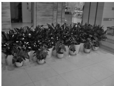
图 5 用也门铁、红掌作空间分割

理的空间中安排植物花卉,还通过不同的空间功能和属性安排不同形态的植物,让空间更加饱满和舒适。