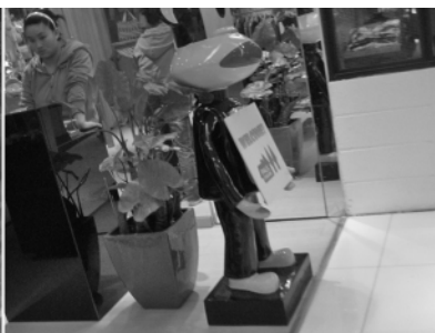
图 7 用海芋将店内与店外空间隔断