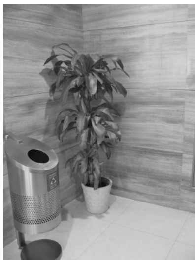
图 9 墙的拐角处应用