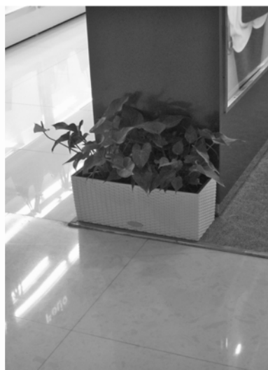
图 10 商铺转角处应用