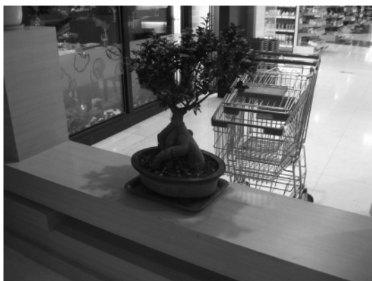
图 3 空间隔断上的榕树小盆景

2.2.1 室内植物的艺术审美 人类的内心都有对自然美的向往。人们对室内植物最早的认识其实并非它的实用性,而是它的审美性。像我国早在 7 000 a 前的新石器时代,人们就将植物移至室内,装点殿堂,后来逐渐引以为风,人们多在案头墙角等地方摆放一些植物作摆设和装饰,陶冶情操,尤其受到文人雅士的推崇。室内植物在商场中的功能也一样,在考虑它的功能性的同时,更多的也是因为它的艺术审美 [6] 。如图 3 为杭州大厦 D 座负一层的榕树( Ficus microcarpa )植物盆景,该盆景放置在 LSE 超市旁边的空间隔断矮墙上,别致的造型充满美感,与空间相互融合。图 4 为国大广场入口的 2 个楼梯之间的隔断空间上的 1 盆一品红( Euphorbia pulcherrima ) [5] ,由雪白的瓷质衬托,与地瓷砖完美融合,鲜艳却不突兀,艳而不俗,美丽至极,并且让原本空无一物的空间不显单调和空旷,富有生气。植物的颜色、形态、植物的种类等都能带来不同的美的感受。