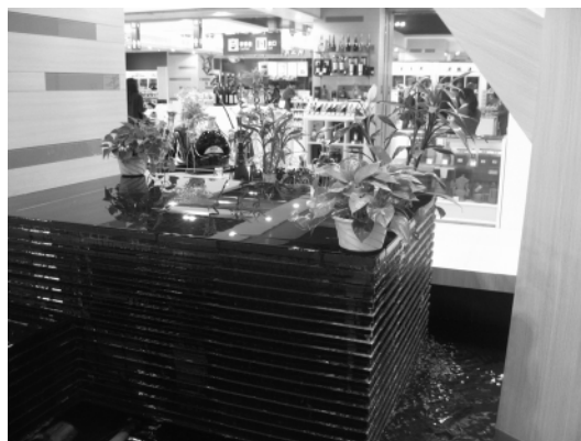
图2 杭州大厦 D 座负一层中庭

2.1.1 营造室内环境的功能 室内植物能够营造出自然的气息, 能够让顾客在购物之余体味自然之味, 放松心情, 让商场更富于生气。图 1、2 是杭州大厦 D 座负一层的中庭, 商场通过瀑布和室内植物的设置, 营造出一种亲近自然的氛围, 使购物者的心情顿时明朗。