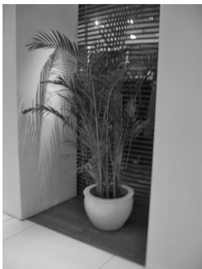
图 8 盆栽散尾葵填充空间