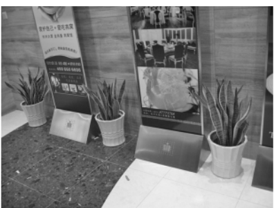
图 12 金边虎尾兰的应用