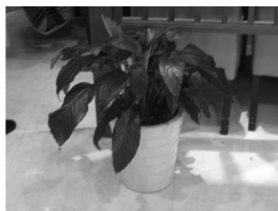
图 13 白鹤芋的应用