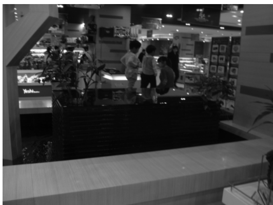
图1 杭州大厦 D 座负一层中庭

商场是大众公共场所, 商场人流量的大小在根本上取决于商场定位和商品丰富性, 此外, 商场氛围和环境的营造亦是其实一个重要的因素, 好的商场环境布置规划和细节的考量能为商场的整体形象提升档次, 更富于人性化和审美情趣。