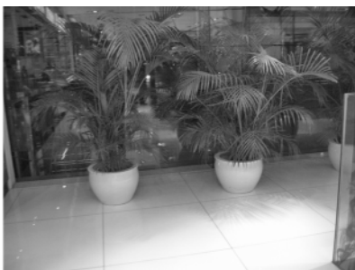
图 6 尾葵盆栽做空间分割