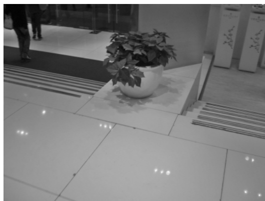
图 4 广场入口的一品红

2.2.2 室内植物的空间分割组合功能 室内植物也常常用来组合空间布局,让空间显得更为和谐丰满,让单调的空间不再单调,让空旷的空间不再空旷,让拥挤的空间显得更有层次 [6] 。室内植物在商场中的空间布局功能主要表现在以下几方面:一是分割空间,即在设计中常常以绿篱、花台等分割大空间,这种分割方法比采用隔墙隔断更灵活,还可以同时起到美化环境的作用。室内植物的分割空间功能主要是通过绿化布置对室内空间进行再组织使各部分保持其功能又不失空间的完整性。图 5、6 为杭州大厦 D 座室内植物作空间分割的示例,分别应用的植物有也门铁( Dracaena arborea )、红掌( Anthurium andraeanum )、散尾葵( Chrysalidocarpus lutescens )。植物隔断带在空间的分割上让空间看起来更加和谐,并且当不需要时可以随时移走,可以根据实际情况更换不同的植物或者其它