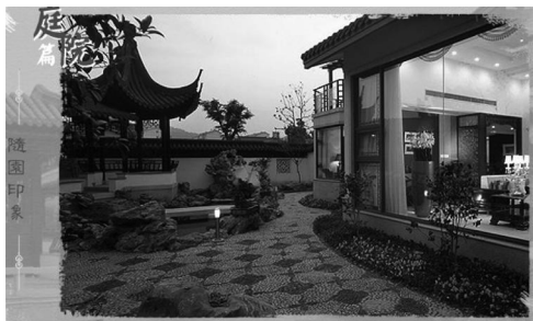
图5 天伦随园庭院中梅花形铺装图案

此外,还有很多植物可以引入现代私家庭院景观当中。如:桂“贵”谐音,栽桂花树有荣华富贵之意;茱萸音似“诸益”,种茱萸有“增年益寿,除病患”之意;合欢,象征婚姻美满、夫妻恩爱,特别适合种植于庭院中;桃树花美果鲜,绿化效果好,传统习俗视桃树为避邪驱害之物,故为庭院常用树种;牡丹为“富贵花”,在庭院中设牡丹台或与寿石、长春花组合,表达“富贵长春”之意;种植月季,意蕴“四季平安”,此类例子不胜枚举。