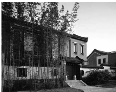
图6 北京观唐别墅前庭景观

择、搭配相似,但由于其空间大、视野宽,与周边环境的协调性要求更高一些,要注意植物文化与庭院文化氛围相融洽。如在校园内的庭院景观设计中,就要抓住校园环境特色,可以选用碧桃和紫叶李等作为主调树种,暗喻“桃李满天下”,颂扬人民教师甘为人梯、无私奉献的精神。如在政府机关的庭院景观设计中,可用竹子作主调树种,表达公务人员虚怀若谷、高风亮节、默默奉献、全心全意为人民服务的精神境界。