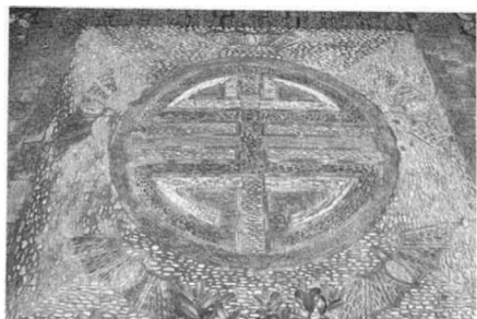
图2 沧浪亭五蝠捧寿铺地图案