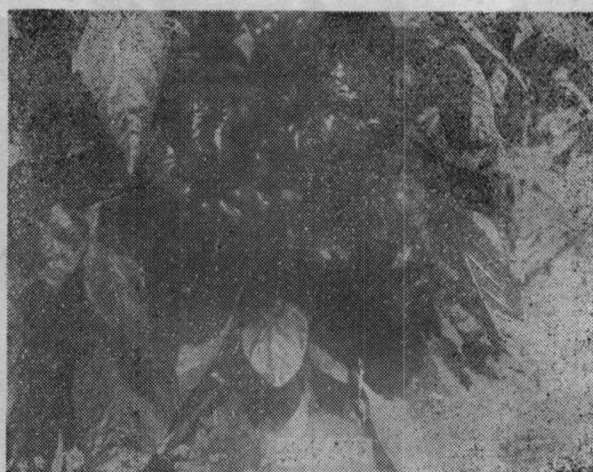
9—1 甜椒品系田间长势表现