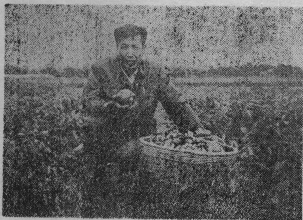
15—3—1 品系田间长势表现